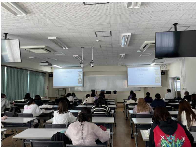
<講義を受ける学生の様子>